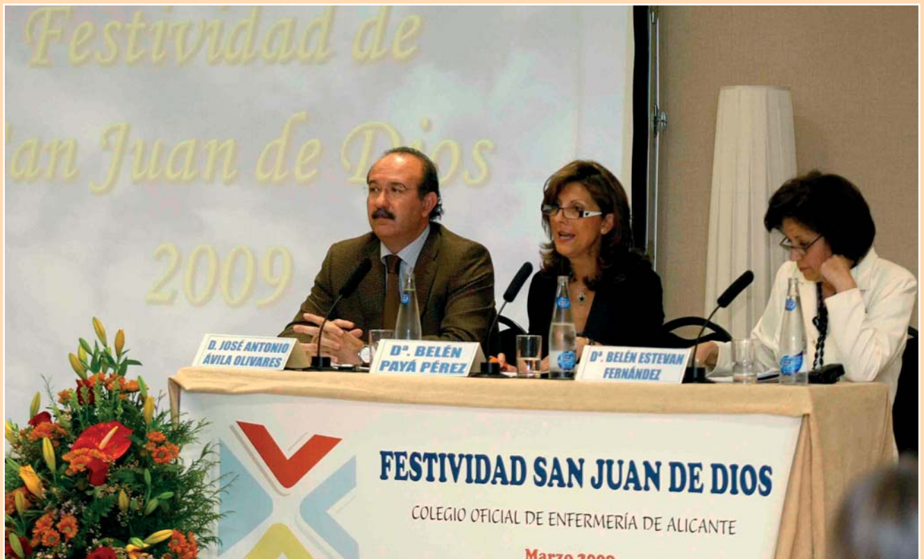
Imagen del acto institucional de 2009

El Colegio de Enfermería de Alicante se encuentra trabajando ya en el programa de actos para conmemorar la celebración de San Juan de Dios, patrón de Enfermería. El mismo comenzará el 1 de marzo y se prolongará hasta el día 12, informándose en próximas circulares de su contenido, si bien se puede indicar ya que el día 12 tendrá lugar el acto institucional que acogerá la entrega de los premios del V Premio de Fotografía sobre temas profesionales de Enfermería, del X Certamen Exposición de Pintura, Dibujo y Manualidades y del XII Concurso Literario de Relatos Breves, así como el resto de apartados habituales (el plazo para la presentación de obras finaliza el 1 de marzo; los interesados en consultar las bases de dichos certámenes pueden hacerlo a través de la web del Colegio www.enferalicante.org o en las oficinas colegiales).