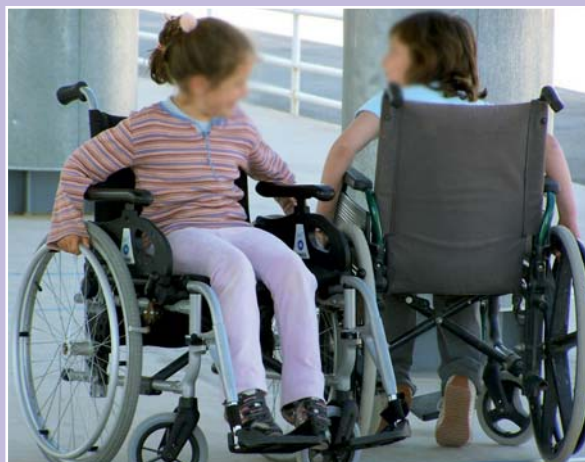
Imagen de una actividad realizada recientemente en el colegio Secanet de Villajoyosa

Desde la Organización Autonómica Colegial de Enfermería se valoró positivamente la incorporación de las profesionales de Enfermería Escolar a cuatro nuevos centros, aunque se exigió mayor agilidad para completar la dotación del resto de colegios. Asimismo, se congratuló de la selección del personal de Enfermería, ya que se ha tenido en cuenta la formación específica, la experiencia y la motivación por trabajar en este tipo de colegios, pero también se está en desacuerdo con las características de las condiciones laborales que lleva consigo la externalización de la gestión de este servicio.