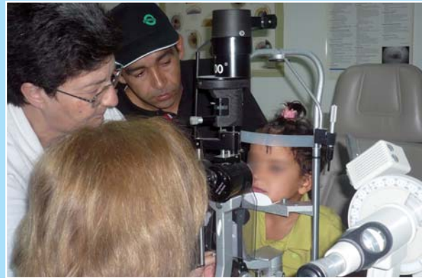
Profesionales del Departamento de Salud de la Marina Baixa en una de sus misiones humanitarias