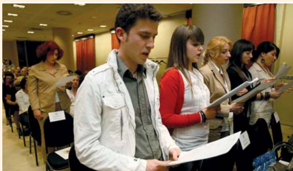
Las nuevas enfermeras realizarán de nuevo el Juramento de la Profesión

Quienes deseen tomar parte en este acto deben contactar con las oficinas del Colegio antes del día 26 de febrero de 2010.