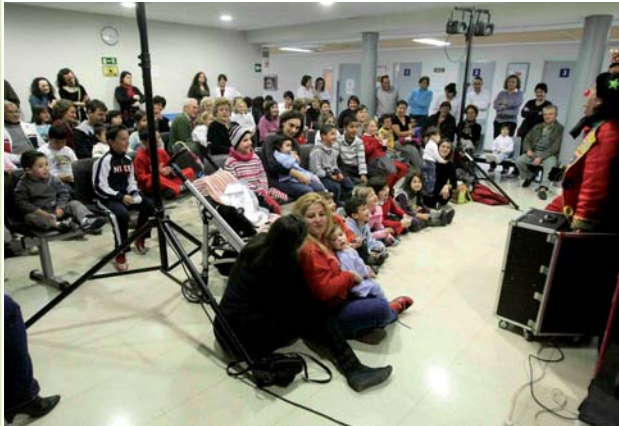
Villajoyosa (arriba) y Elche (abajo) se volcaron con la celebración de esta actividad un año más

Desde la Junta de Gobierno del Colegio se quiere agradecer la colaboración de las direcciones de Enfermería de los centros en los que se ha desarrollado este actividad para haber podido llevarla a cabo