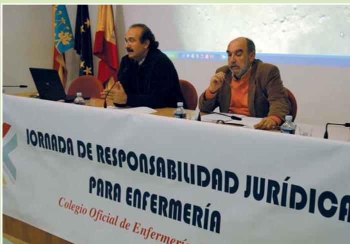
La potenciación de las actividades científicas y profesionales volverá a ser uno de los objetivos prioritarios