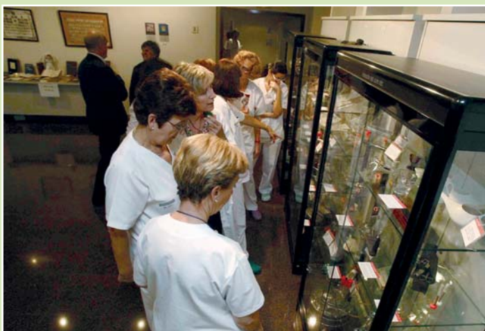
El Museo de la Profesión durante las últimas jornadas de Enfermería sobre Trabajos Científicos del Hospital General de Alicante