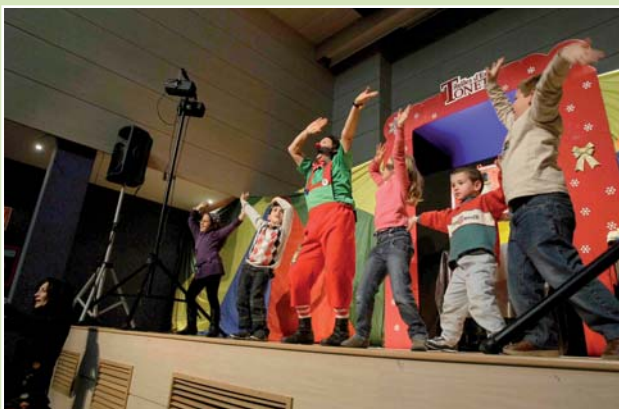
Imagen de la celebración en Alicante