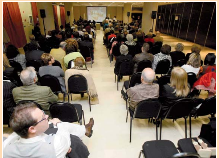
Los colegiados dan un importante apoyo año tras año a esta celebración

Durante el acto institucional, que se celebrará en el Hotel Porta Maris de Alicante a las 18 horas, se efectuarán también los homenajes a los compañeros jubilados en 2009, a los que celebran 50 años de colegiación y al profesional de más edad de la provincia de Alicante. Junto a ello volverá a realizarse el Juramento de la Profesión, que se celebró por prime-