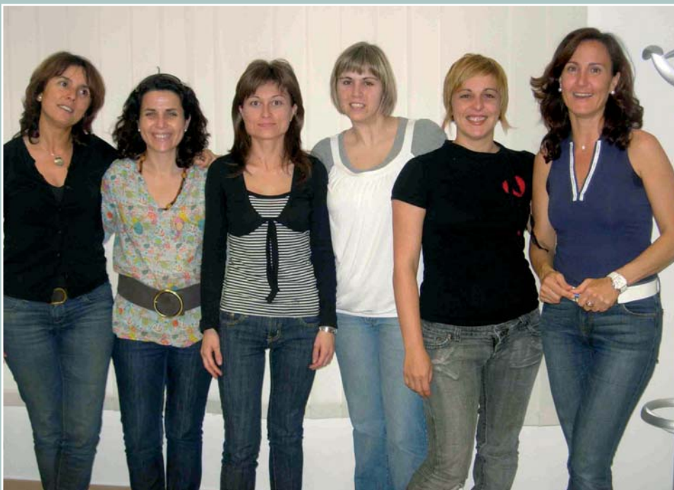
Las enfermeras participantes en estos talleres junto a técnicos de la Concejalía

En sus ediciones anteriores estos talleres han sido muy bien aceptados por parte del alumnado y profesorado. Tras los resultados obtenidos en las evaluaciones se ha observado que los alumnos de los institutos de Alicante han modificado su actitud frente al alcohol, han aprendi-