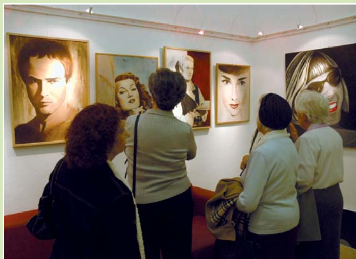
Los colegiados tienen a su disposición el área de exposiciones para dar salida a su creación artística

En el apartado cultural y social cabe destacar la proyección que se va a seguir dando a la sala de exposiciones del Colegio para que los colegiados puedan usarla para mostrar en ella sus obras, dando salida y potenciando su creación artística. Asimismo se va a seguir realizando un importante esfuerzo para dar forma al Museo de la Profesión y crear un espacio histórico para su ubicación.