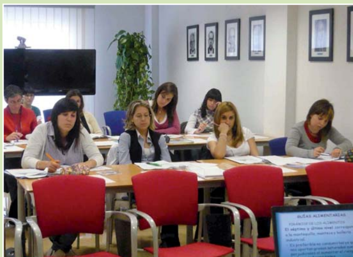
Las actividades formativas vuelven a ser una apuesta decidida