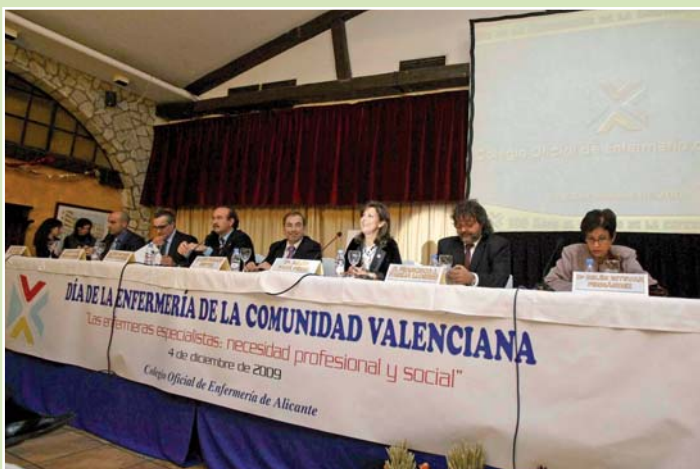
El respaldo de los colegiados a actividades como el Día de la Enfermería de la Comunidad Valenciana nos anima a seguir en la organización de actos sociales

El Colegio de Enfermería de Alicante celebró a finales del pasado año su Asamblea General Ordinaria en la que, junto a la lectura de los presupuestos para 2010, se dio cuenta de los objetivos de la Junta de Gobierno que marcarán las pautas de la actividad colegial durante el presente año, puntos, todos ellos, que fueron aprobados y que contemplan, entre otros aspectos, mantener la misma cuota colegial ofreciendo, e incluso incrementado, las prestaciones, como sucede con el seguro de responsabilidad civil, que ha aumentado su cobertura.