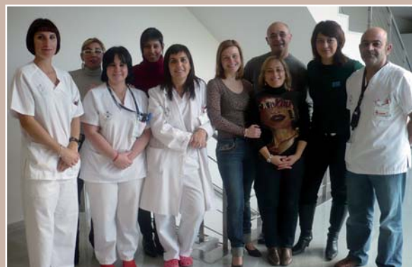
Imagen de los integrantes de la Unidad

reflejada en la obtención del premio a la mejor iniciativa institucional de nuestro país en la prevención de las úlceras por presión, otorgado por unanimidad por el jurado de los premios PREVENICARE, que entrega la Fundación Sergio Juan Jordán para la investigación y estudio de las heridas crónicas en colaboración con Smith & Nephew y el cual se hizo entrega en un acto institucional el pasado día 18 de diciembre.