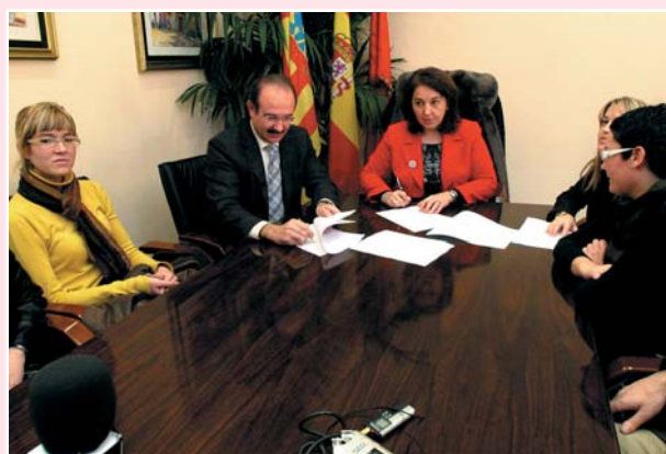
Imagen de la firma del convenio

El Consejo de Enfermería de la Comunidad Valenciana (CECOVA), en colaboración con el Colegio de Enfermería de Alicante, ha suscrito un convenio con el Ayuntamiento de Elda, a través de la Concejalía de Sanidad, gracias al cual se ha dotado con una Enfermera Escolar al Colegio de Educación Especial Miguel de